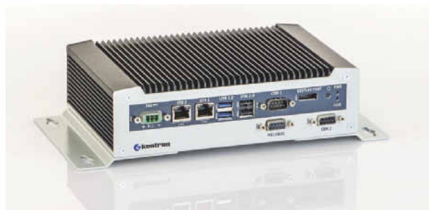
Die IPCs decken mit einer Performance zwischen Atom-, Celeron- und i7-Prozessor ein breites Anwendungsspektrum ab