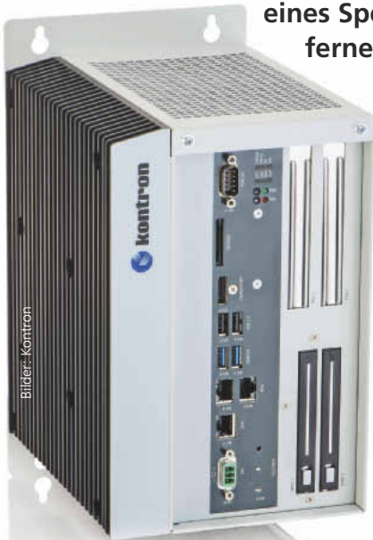
Die Industrie-PCs der KBox-Reihe sind wartungsfrei sowie skalier- und erweiterbar

Unternehmen werden zukünftig ihre Maschinen, Lagersysteme und Betriebsmittel weltweit als Cyber-Physical-Systems (CPS) vernetzen – so steht es in den Umsetzungsempfehlungen für das Zukunftsprojekt Industrie 4.0 der Acatech. In wie weit sind die Technologien für eine solche Aufgabe heute schon vorhanden? Aus Sicht von Kontron, eines Spezialisten für Embedded Computing, ist Industrie 4.0 keine Vision einer fernen Zukunft, sondern schon heute in weiten Teilen realisierbar.